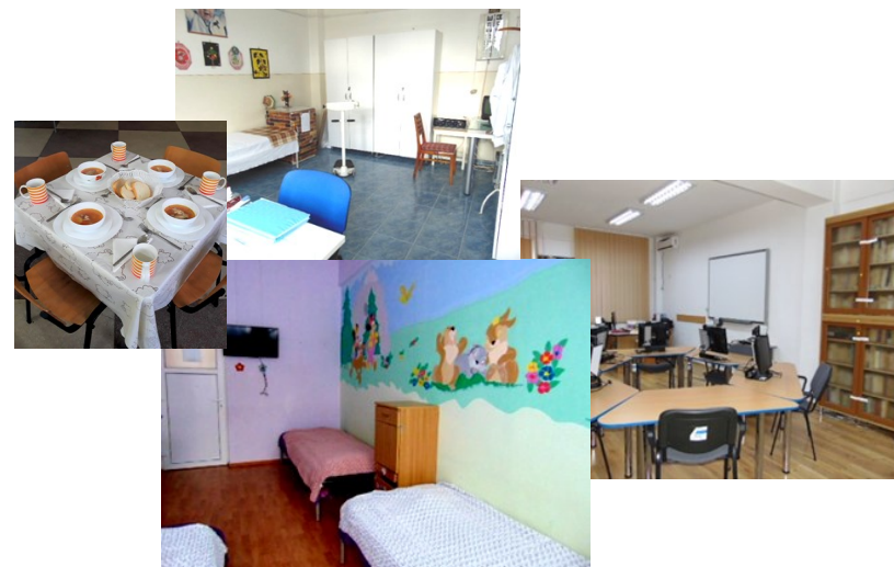
Imagini din cabinetul medical, cantină, bibliotecă și dormitor.